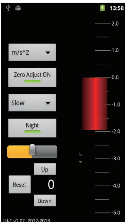
夜間モード表示例