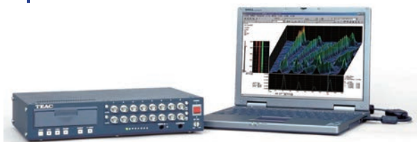
TEACレコーディングユニットLX/WXシリーズ用